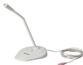
BUFFALO マイクロフォン BSHSM06WH 参考価格: ¥ 1,000