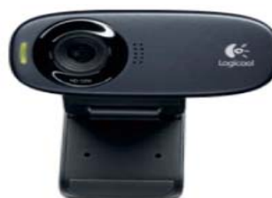
HD Webcam C310 型番: C310 ロジテック オンラインストア価格 1P¥ 3,480 HD 720pのテレビ電話 500万画素 (静止画) RightLight™2テクノロジー